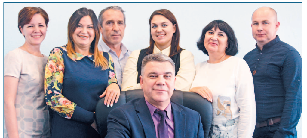
В состав профсоюзного комитета ППО УКРНО входят и представители совета женщин предприятия

Работа женсовета – не только развлечения, но и серьёзные социально-производственные вопросы по защите социальных, правовых, экономических интересов женщин, культурно-просветительская, организационно-массовая работа. В 2017 году женсовет УКРНО признан одним из лучших