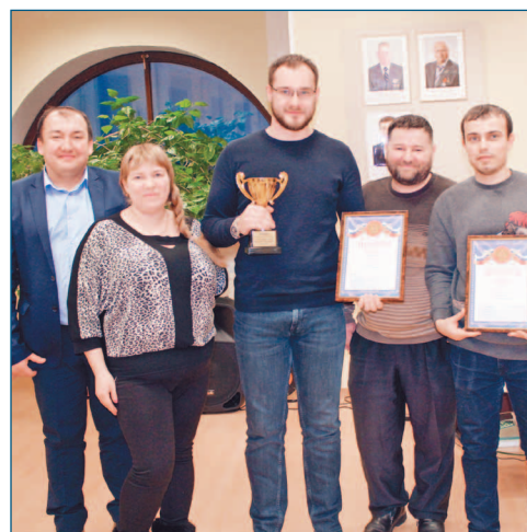
Команда управления производственно-технологической комплектации СМТ-2 – победитель «Ринга эрудитов»

Первая игра собрала шесть команд: СМУ-3 (строительно-монтажное управление №3), СМУ-4 (строительно-монтажное управление №4), УПТК (управление производственно-технологической